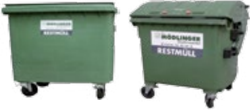
GROSSRAUM-CONTAINER (IN WOHNHAUSANLAGEN)